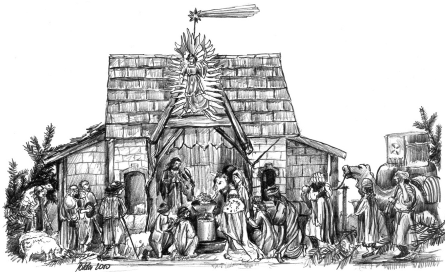
Vratislavický betlém – symbol vánočních svátků