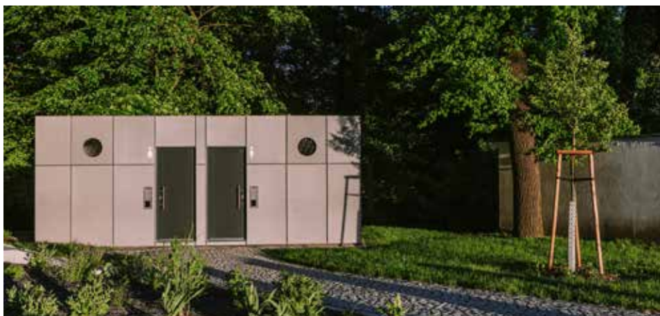
Nové hygienické zázemí v lesoparku