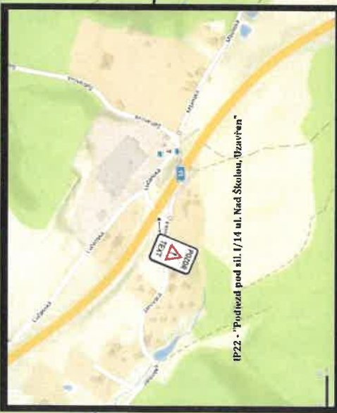
IP22 - "Podjezd pod sil. I/14 ul. Nad Skolou, uzavřen"