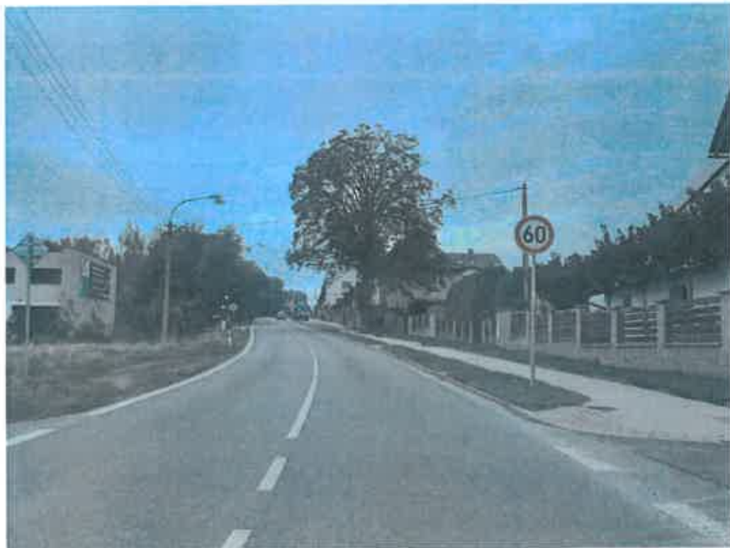
Ve směru na Jablonec nad Nisou