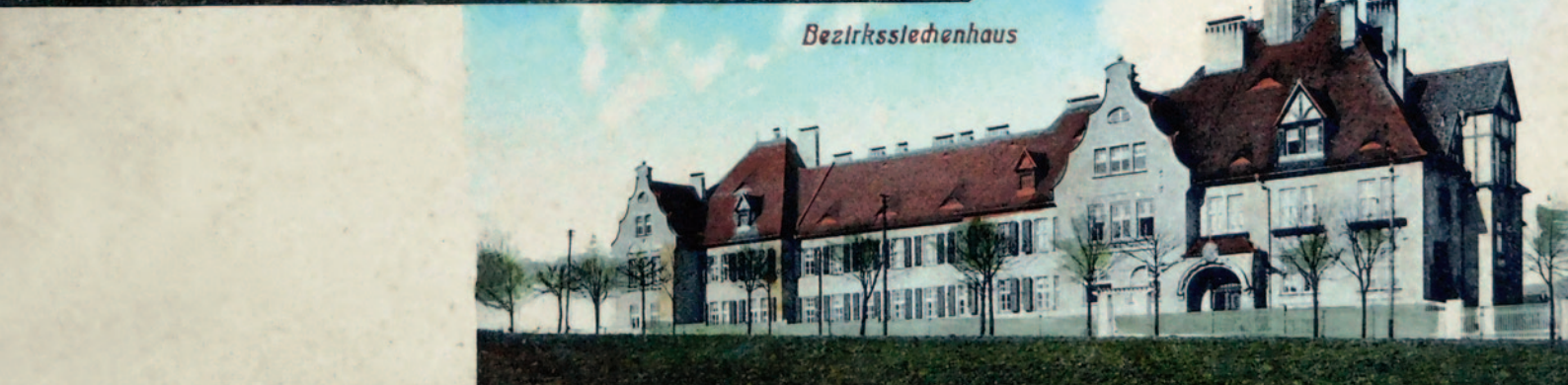
Pečovateľský dům Martha a okresní chorobinec vznikly na Nové Rudě na samém počátku 20. století. Státní ústav byl na výsluní nad Vratislavicemi otevřen jen pouhé čtyři roky po zahájení činnosti soukromého ginzkeyovského sociálního domu.

Maffersdorf Mein Gott ich bin so froh das du mich hierher geschickst. Mein Leben ist hier so schön und ich bin so dankbar! Gott segne dich und alle!