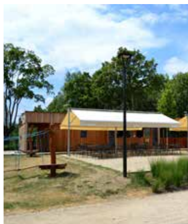
Park Nové Vratislavice