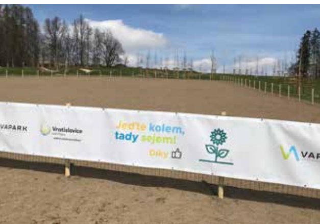
Výsadba pobytové louky ve VAPARKu