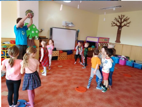
Ekologické centrum Střevlík – třídíme odpady