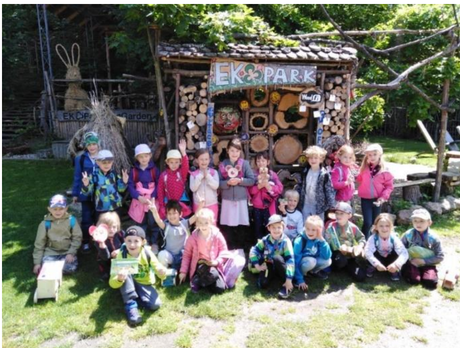
Návštěva EKO Parku Liberec