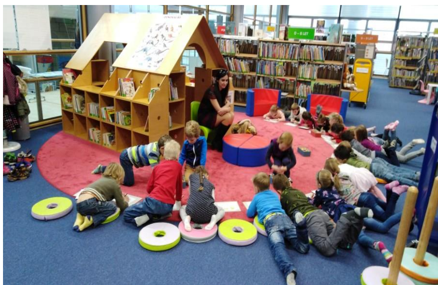
Návštěva krajské knihovny