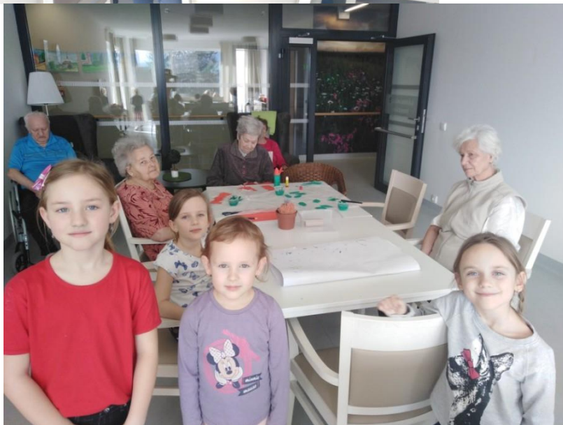
Děti na návštěvě v SENECUŘE ve Vratislavicích