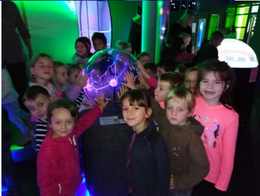
IQlandia – třída Kuřátek