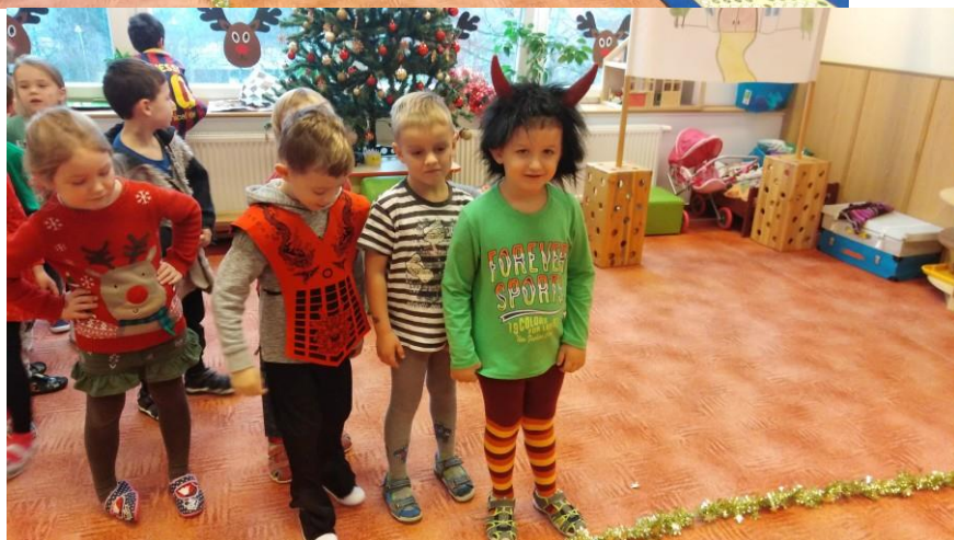
Čert a Mikuláš 2019 ☺