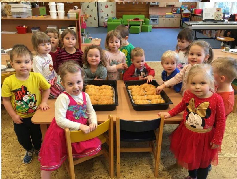
Hvězdičky pečou housky...