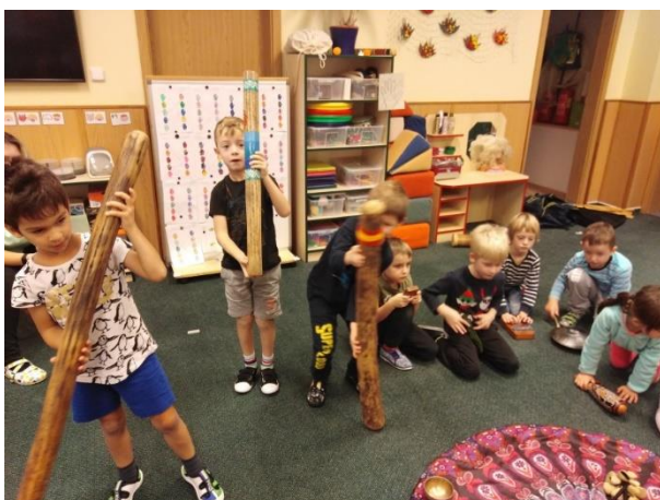
Muzikoterapie v MŠ