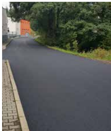
Rekonstrukce povrchu v ul. Dopravní