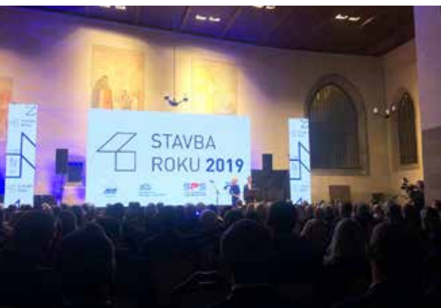
Vyhlašování Stavby roku v Betlémské kapli v Praze

Uzávěrka příštího zpravodaje: 20. 11. 2019 Více informací naleznete na www.vratislavice.cz