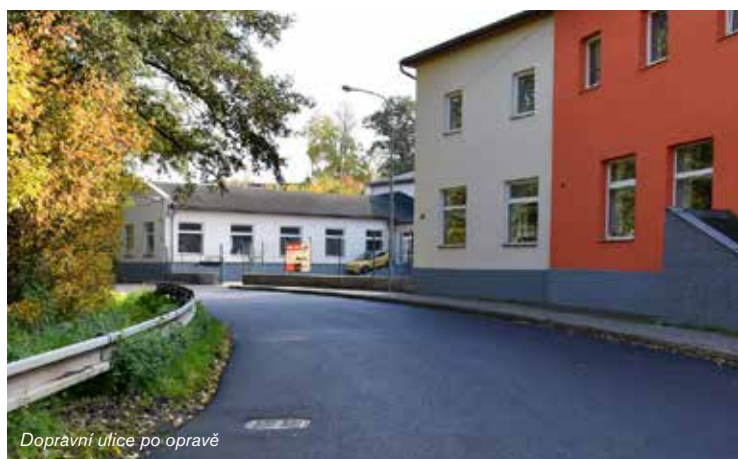
Dopravní ulice po opravě