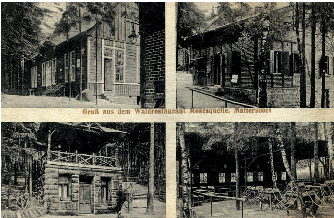
Grüß aus dem Waldrestaurant Mosesquelle, Matfersdorf

K původně osamělé budově lesní restaurace přibylo postupně hned několik objektů. Zřízeny byly kryté verandy s výhledem na Vratislavice a do lesa, taneční parket i besídka pro hudbu.