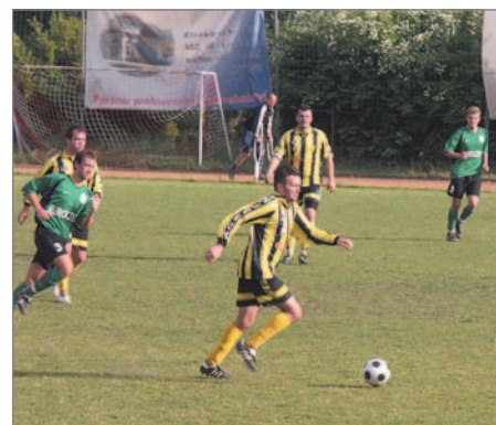
V posledním utkání ročníku 2007/8 zvítězili fotbalisté Vratislavic na domácím hřišti nad Českým Dubem 3:1