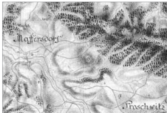
Výřez z mapy tzv. 1. vojenského mapování z let 1764-1783, malý čtvereček uprostřed znázorňuje vojenské opevnění na „tajemném“ kopci, v levé horní části mapy se nachází „Wacht b.“, dnešní Strážný vrch

Podíváme se nyní podrobněji na jména takovýchto kopců. Z jejich pojmenování již mnohdy na první pohled vysvítá pohnutá vojenská minulost. Samotný Strážný vrch nad hasičárnou je od konce 18. století nazýván Wacht berg, na mapě tzv.