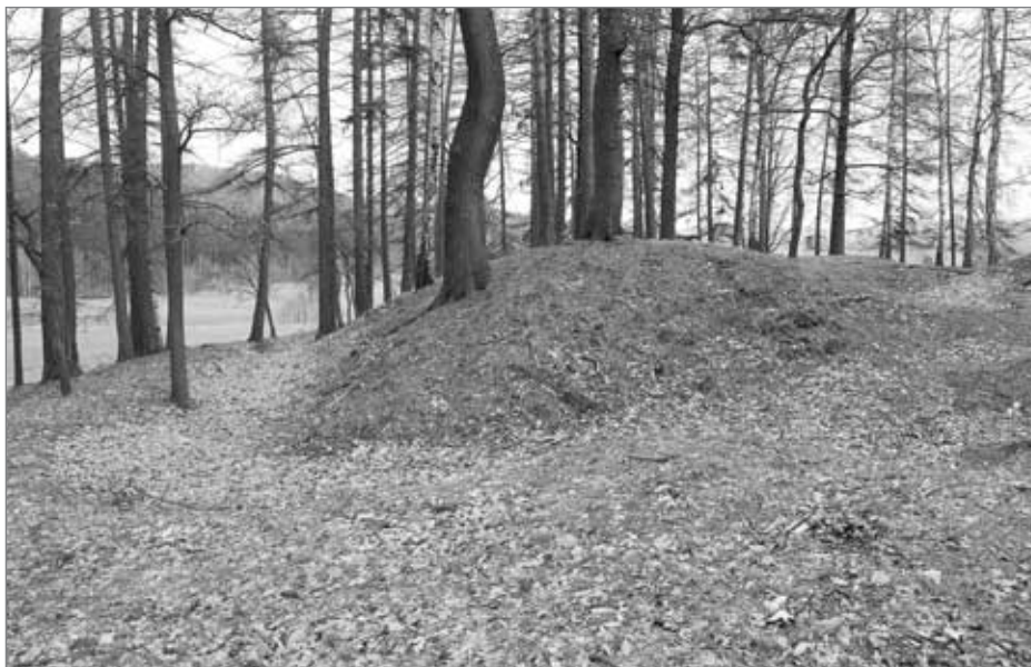
„Tajemný“ kopec - detail jednoho z návrší, patrně původní palebné postavení pro dělo

okolní terén, začalo mi pomalu svítat a původně zdánlivě náhodné terénní nerovnosti začaly tvořit jasný systém příkopů, valů a plošin. Ale k čemu to