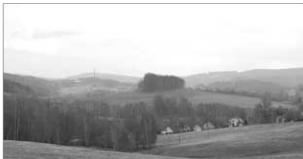
Uprostřed fotografie vidíme „tajemný“ kopec, který byl původně nazýván Šance

mezi Vratislavicemi a Prosečí. A pokud sem někdy povedou Vaše kroky, věnujte vzpomínku vojákům, kteří zde byli nuceni sloužit a bojovat. Martin Nechvíle