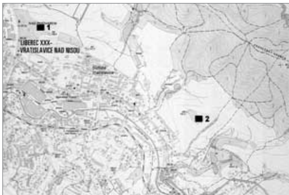
Současná mapa Vratislavic a okolí. 1 - Strážný vrch, 2 - „tajemný“ vrch, dříve nazývaný Šance

2. vojenského mapování z let 1836-1852 je nazýván jako Signal B. (tedy v překladu Signální kopec). Na mladších mapách je pak opět shodně nazýván jako Wacht B. A co víme o jméně našeho „tajemného kopce“? Měl někdy nějaké, které by prozrazovalo jeho neklidnou minulost? Na současných mapách je uveden beze jména, ale bylo tomu tak vždy? Poprvé se se jménem tohoto kopce setkáváme na mapě tzv. 3. vojenského mapování z let 1877-1880, kde je nazýván Šance. Toto jméno se v německé podobě Schanze na mapách běžně objevovalo do 2. světové války. Po odsunu Němců byl název postupně zapomenut. O čem však název samotný vypovídá a co znamená? Jméno Šance bylo dáváno zpravidla místům, kde